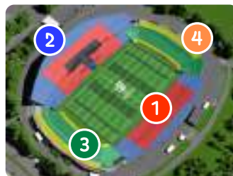
スタッド・ドゥ・ラ・ボージュワール