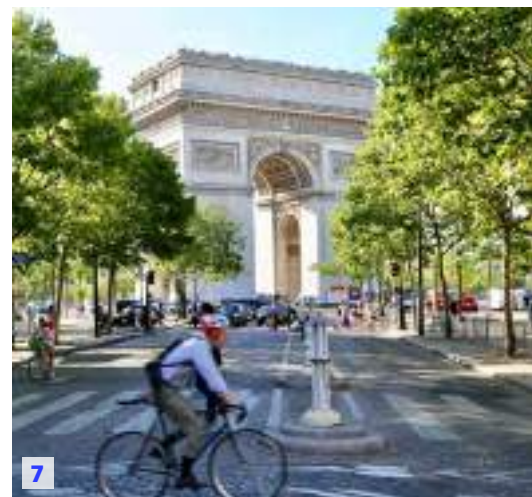
1. パッサージュ ボムレ, ナント。(秋季撮影) Passage Pommeraye, Nantes. This photo was taken during the autumn season. / 2. 旧港, マルセイユ。Old Port of Marseille. / 3. ノートルダム・ドゥ・ラ・ガルド寺院, マルセイユ。(夏季撮影) Basilique Notre-Dame de la Garde, Marseille. This photo was taken during the summer season. / 4. パリ, フランス。Paris, France. / 5. イフ城, マルセイユ。Château d'If, Marseille. / 6. エッフェル塔, パリ。(夏季撮影) Tour Eiffel, Paris. This photo was taken during the summer season. / 7. エトワール凱旋門, パリ。(夏季撮影) Arc de Triomphe, Paris. This photo was taken during the summer season.