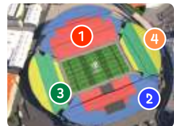
スタッド・ヴェロドローム