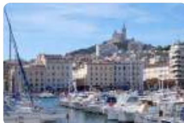
旧港、マルセイユ。(夏季撮影) Old Port of Marseille. This photo was taken during the summer season.