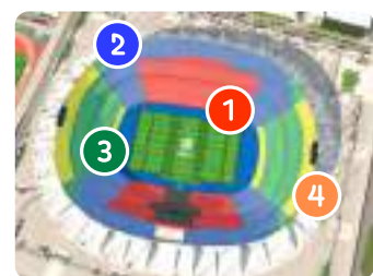
スタッド・ド・フランス