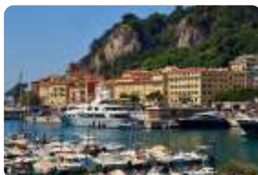
ポール・ランピア、ニース。(夏季撮影) Port Lympia, Nice. This photo was taken during the summer season.