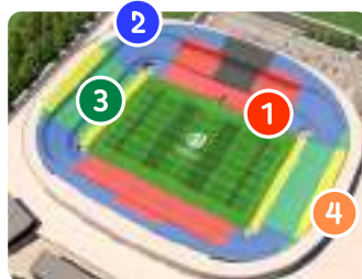
スタッド・ド・ニース