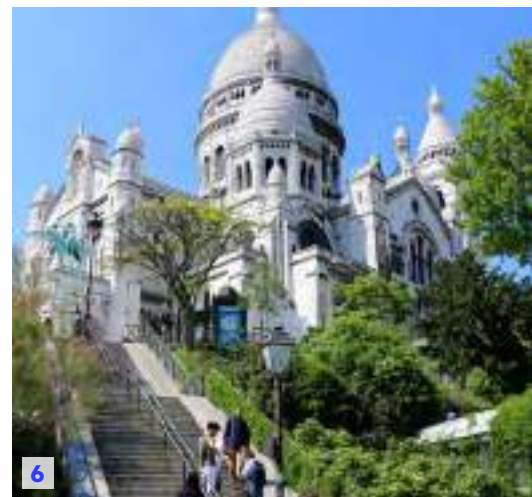
1. エトワール凱旋門、パリ。(夏季撮影) Arc de Triomphe, Paris. This photo was taken during the summer season. / 2. パリ、フランス。Paris, France. © Paris Tourist Office - Photographe : Amélie Dupont / 3. ボルドーブドウ園、Aコース。(夏季撮影) Vineyards, Bordeaux, Package A. / 4. エッフェル塔、パリ。(夏季撮影) Tour Eiffel, Paris. This photo was taken during the summer season. © Paris Tourist Office - Photographe : © Sarah Sergent / 5. エッフェル塔、パリ。(夏季撮影) Tour Eiffel, Paris. This photo was taken during the summer season. © Paris Tourist Office - Photographe : © Sarah Sergent / 6. サクレ・クール寺院、パリ。(夏季撮影) Basilique du Sacré-Coeur de Montmartre, Paris. This photo was taken during the summer season. © Paris Tourist Office - Photographe : © Sarah Sergent