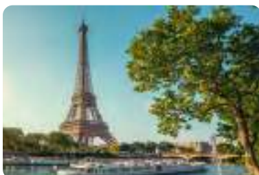
エッフェル塔、パリ。(夏季撮影) Tour Eiffel, Paris. This photo was taken during the summer season.

Bordeaux has so much to offer. Explore the art, culture, wineries and more. A perfect destination for the rugby trip of a lifetime.