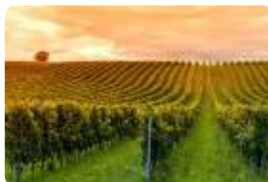
ボルドーブドウ園。(夏季撮影) Vineyards, Bordeaux. This photo was taken during the summer season.