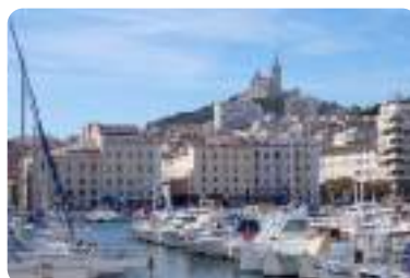
旧港、マルセイユ。(夏季撮影) Old Port of Marseille. This photo was taken during the summer season.