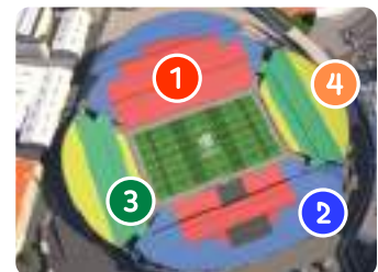
スタッド・ヴェロドローム