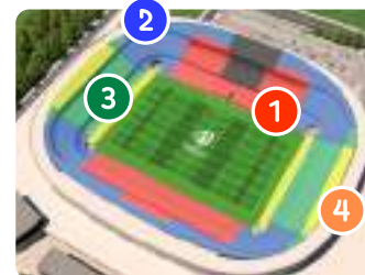
スタッド・ド・ニース