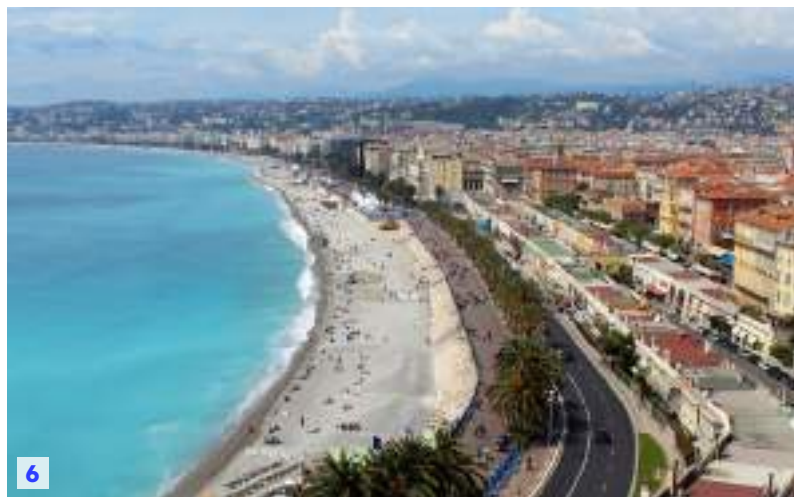
1. プロムナード・デ・ザングレ, ニース。(夏季撮影) Promenade des Anglais, Nice. This photo was taken during the summer season. / 2. トゥールーズ・サンセルナン教会, トゥールーズ。(秋季撮影) Basilica of Saint-Sernin, Toulouse. This photo was taken during the autumn season. / 3. キャピトル, トゥールーズ。Capitole de Toulouse. / 4. ケ・ドゥ・ラ・ドラド, トゥールーズ。(秋季撮影) Quai de la Daurade, Toulouse. This photo was taken during the autumn season. / 5. ポール・ランピア, ニース。(夏季撮影) Port Lympia, Nice. This photo was taken during the summer season. / 6. プロムナード・デ・ザングレ, ニース。(夏季撮影) Promenade des Anglais, Nice. This photo was taken during the summer season.