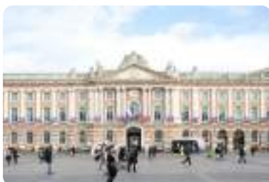
キャピトル広場、トゥールーズ。(秋季撮影) Place du Capitole in Toulouse. This photo was taken during the autumn season.

You will spend two nights in Nice, the cultural capital of the French Riviera. Enjoy the quaint streets of the Old Town or take a stroll along the world-famous Promenade des Anglais before enjoying a classic Provençal meal in one of the city's intimate cafés. A perfect destination for the rugby trip of a lifetime.