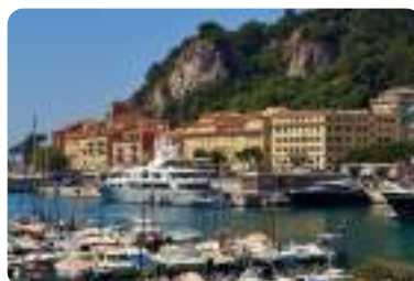
ポール・ランピア、ニース。(夏季撮影) Port Lympia, Nice. This photo was taken during the summer season.