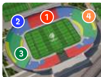
スタジアム・ドゥ・トゥールーズ