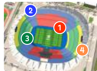
スタッド・ド・フランス