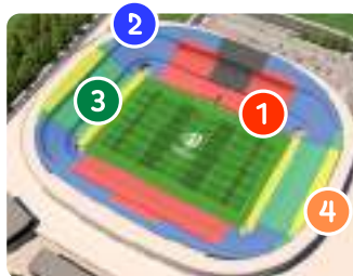
スタッド・ド・ニース