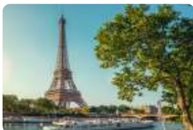
エッフェル塔、パリ。(夏季撮影) Tour Eiffel, Paris. This photo was taken during the summer season.

Travel to Paris by TGV, France's high-speed rail service. Enjoy the monument-lined boulevards, great art repositories, fantastic historic monuments and the delightful riverscape of France's beautiful capital. A not-to-miss tourist destination.