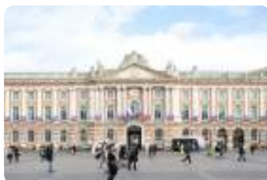
キャピトル広場、トゥールーズ。(秋季撮影) Place du Capitole in Toulouse. This photo was taken during the autumn season.