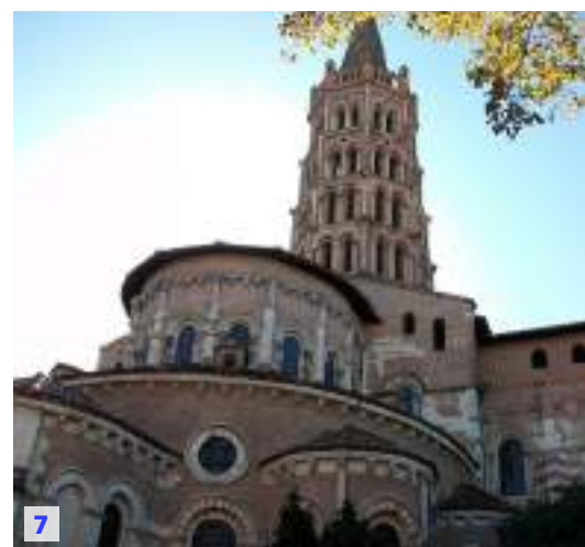
1. エトワール凱旋門、パリ。(夏季撮影) Arc de Triomphe, Paris. This photo was taken during the summer season. / 2. パリ、フランス。Paris, France. © Paris Tourist Office - Photographe : Amélie Dupont / 3. エッフェル塔、パリ。(夏季撮影) Tour Eiffel, Paris. This photo was taken during the summer season. © Paris Tourist Office - Photographe : © Sarah Sergen / 4. エッフェル塔、パリ。Tour Eiffel, Paris. © Paris Tourist Office - Photographe : © Sarah Sergen / 5. ケ・ドゥ・ラ・ドラド、トゥールーズ。(秋季撮影) Quai de la Daurade, Toulouse. This photo was taken during the autumn season. © Atout France/Maurice Subervi / 6. キャピトル、トゥールーズ。Capitole de Toulouse. / 7. トゥールーズ・サンセルナン教会、トゥールーズ。(秋季撮影) Basilique Saint-Sernin de Toulouse. This photo was taken during the autumn season.